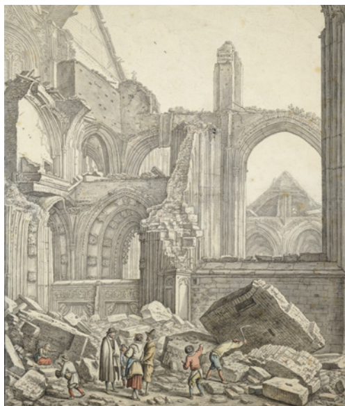
Dom in puin tussen 1674 en 1685.

1 254 en 1674 zijn in elk geval bepalend geweest voor hoe het Domplein er nu uitziet. In 1254 werd namelijk de eerste steen gelegd voor de Utrechtse Dom (niet de toren, maar de kathedraal waar de toren onderdeel van uitmaakte). 263 jaar later stopte de bouw volledig; de Domtoren had toen net een renovatie achter de rug. Eigenlijk was de kathedraal nog niet af. Het middenschip, het gedeelte dat tussen de huidige Domkerk en Domtoren staat, had een houten plafond in plaats van een stenen gewelf. Luchtbogen waren achterwege gelaten; dat bouwt namelijk goedkoper. Want ja, het geld was op.