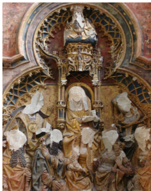
Altaarretabel, beschadigd in 1572 tijdens beeldenstormen van de protestantse Reformatie.

Op en onder het plein vind je tweeduizend jaar aan opgestapelde geschiedenis. Er is veel meer dan je zou denken als je langs snelt op weg naar een afspraak. Zo veel, je zou er keuzestress van krijgen. Mijn advies is daarom: niet kiezen, doe alles. Bezoek de kerk, waar je nog sporen van de beeldenstorm kunt vinden. Ga naar de naastgelegen Pandhof, omdat het zo'n mooie plek is. Ontdek DOMunder, reis terug tot aan de Romeinen en bezoek het Paleis Lofen, dat in juni van dit jaar is geopend. Vergeet de toren niet, die 495 treden en het verhaal van de gids zijn het echt waard, zelfs nu de toren gerestaureerd wordt.