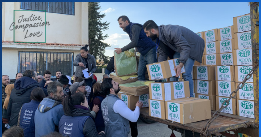
ADRA Syrië deelt voedselpakketten. Elk pakket bevat genoeg voedsel voor een gezin voor vijf dagen.

Na twee lange coronajaren konden we vorig jaar mei eindelijk weer een echte ADRA Contactdag organiseren. Het werd een gezellige ontmoeting met bekenden en nieuwe gezichten. Tegelijkertijd bracht het thema 'Vluchten'