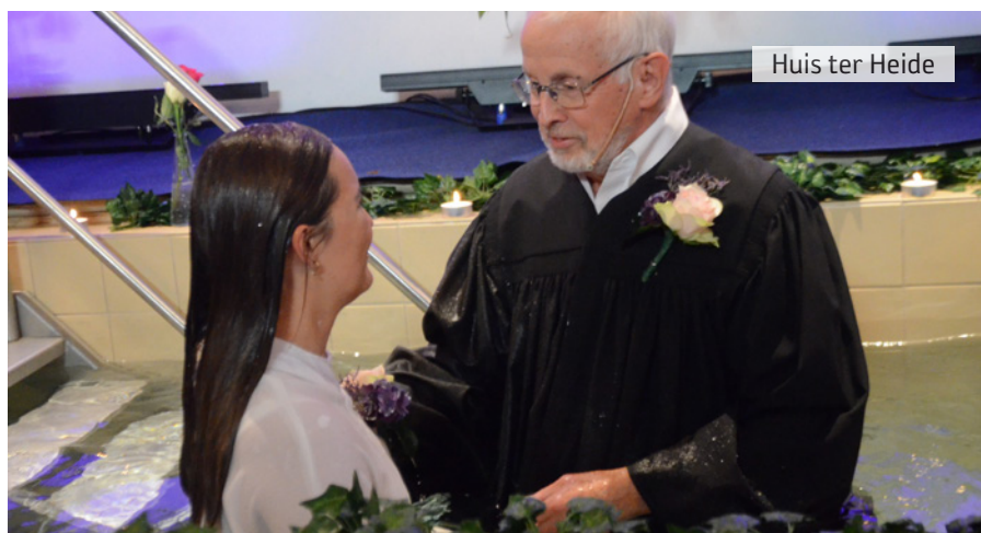
Huis ter Heide