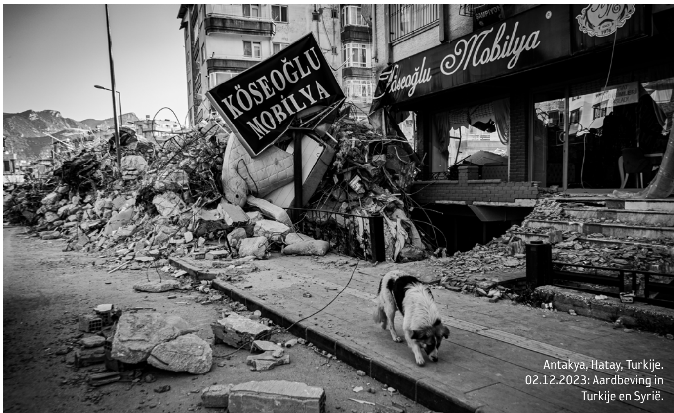
Antakya, Hatay, Turkije. 02.12.2023: Aardbeving in Turkije en Syrië.