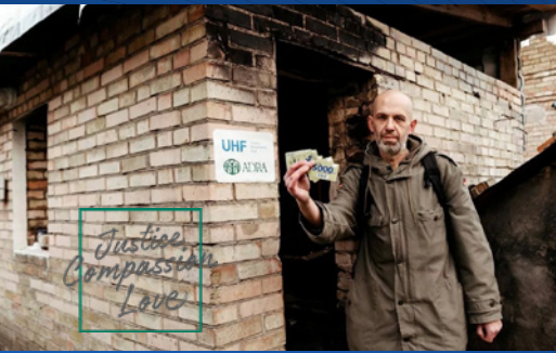
Financiële tegemoetkoming – bevolking Oekraïne

Aan het station zit een gigantisch winkelcentrum vast. Op het stationsplein zie je de armoede en voel je het leed en de wanhoop. Je neemt de volgende deur en mensen lopen met tassen vol dure kleding. Gezellig aan het shoppen alsof er niks aan de hand is. Je stapt letterlijk een andere wereld binnen. Het was echt bizar.'