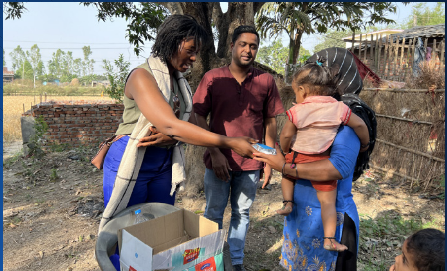
ADRA Nepal kookworkshops waarin hele dorpen onderwijs krijgen.

Om de kinderen en hun moeders te helpen, heeft ADRA samengewerkt met klinieken in de provincie Mahottari. Zo werden de vrouwen