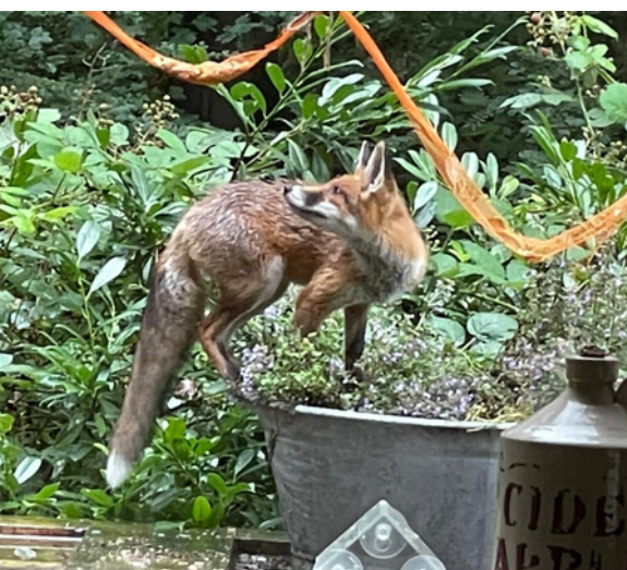
Je kunt op het landgoed van de kerk zomaar een vosje tegenkomen

Een oud plan is – en als het ware geadopteerd door Heidi en Rozita – om aan de rand van het landgoed een gezondheidscentrum