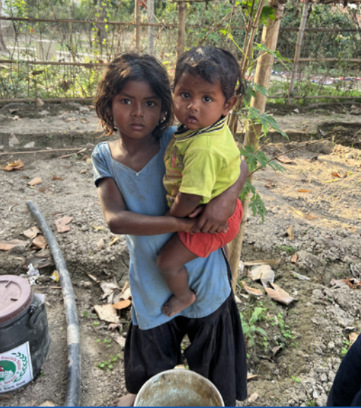
Er heerst grote armoede in het gebied.