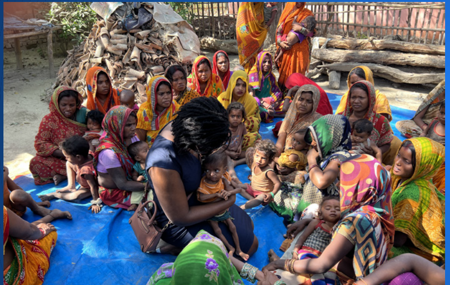
Er zijn nog veel nieuwe moeders en kleine kinderen die strijden tegen ondervoeding.